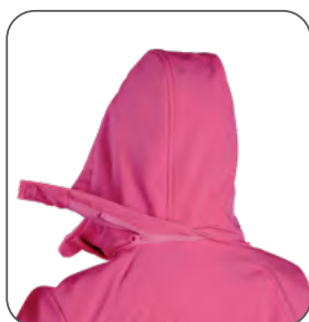
odepínací kapuce odnímateľná kapucňa detachable hood odpinany kaptur