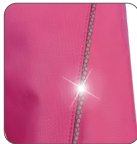
reflexní doplňky reflexné doplnky reflective accessories elementy odblaskowe