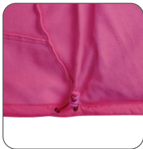
stažení v dolní části stiahnutie v dolnej časti tightening at the bottom ściągacz w dolnej części