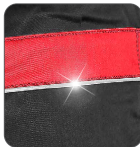
reflexní doplňky reflexné doplnky reflective accessories elementy odblaskowe