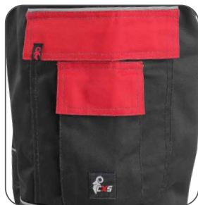
multifunkční kapsy multifunkčné vrecká multifunctional pockets kieszenie wielofunkcyjne