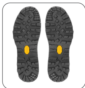
podešev podošva outsole podeszwa