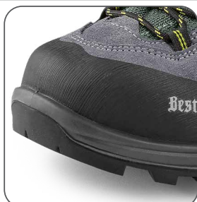
zesílená přední část proti okopu vonkajšia ochrana špičky reinforced TPU overcap nosek z TPU wzmocnieniem