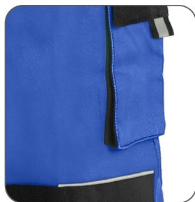
reflexní doplňky reflective accessories elementy odblaskowe