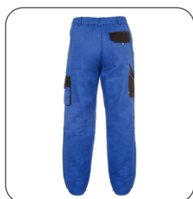
zadní strana back side z tyłu