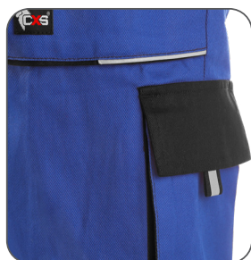
reflexní doplňky reflective accessories elementy odblaskowe