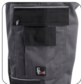
multifunkční kapsy multifunctional pockets kieszenie wielofunkcyjne