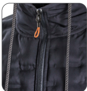
reflexní doplňky reflective accessories elementy odblaskowe