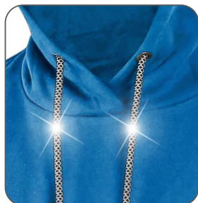
reflexní tkanice reflexné šnúrky reflective drawstrings sznurówki odblaskowe