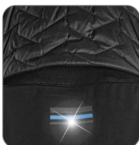
ventilace na zádech ventilácia na zadnej strane ventilation on the back wentylacja z tyłu