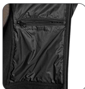
vnitřní kapsa vnútorné vrecko inner pocket kieszeń wewnętrzna